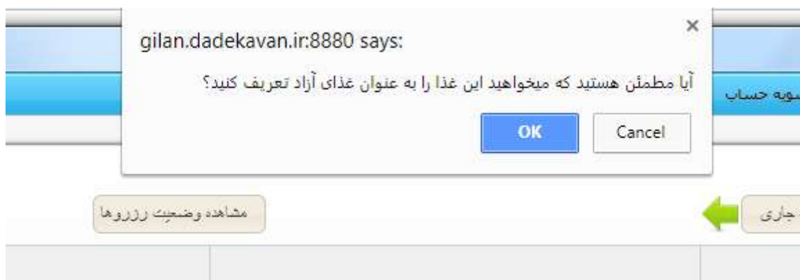
تصویر شماره ۲

سید آبی رنگی را در کنار غذای رزرو شده ی خود خواهد دید که با کلیک کردن بر آن از دانشجو سوال پرسیده می شود که آیا اطمینان دارد که غذای رزرو شده ی خود را به صورت آزاد برای خرید دیگران اعلام کند. (تصویر شماره ۲)